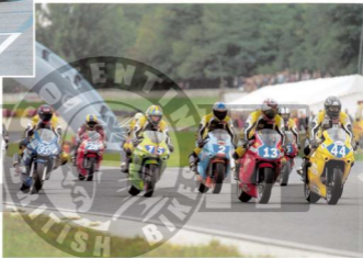
G rard (N  44) en t te avec la meute   ses trousses...

“En passant devant les stands et voyant tout le team les bras en l’air et avec le sourire, j’ai compris que nous vivions un grand moment...Les Ducati n’arrivaient pas   suivre la cadence du Speed !”