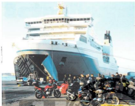
A l'année prochaine !

faire parler la puissance des trois cylindres. Tout au « Torque », la route était un régal !!