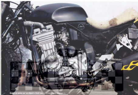
Quand on pense qu' au départ c'était une fork respectable Baysara !!

Certains n'aiment pas, mais l'effet dramatique est garanti.