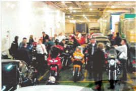
L'embarquement : tout le monde surveille l'arrimage !