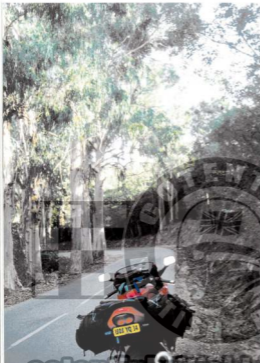
La route du pénitencier de milieu des eucalyptus.

Votre narratrice présente le soleil à Bonifacio !