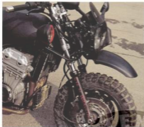
Garde-boue surélevé, Pneus à têtes, phares de Land Rover !!

Les silencieux avales parfaitement horribles proviennent d'une Golf ... Pour tenir le tout, fil de fer et bandes adhésives !!