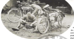
Les estafettes au camp d'entraînement en 1917 sur des Triumph H

constructeurs tâtonnaient, certains plaçant même le moteur derrière la roue. Le bon sens triompha pour presque tous, mais Mauritz Schulte choisit une conception saine qui allait s'imposer.