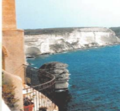
Les côtes caillonnées de Bonifacio.